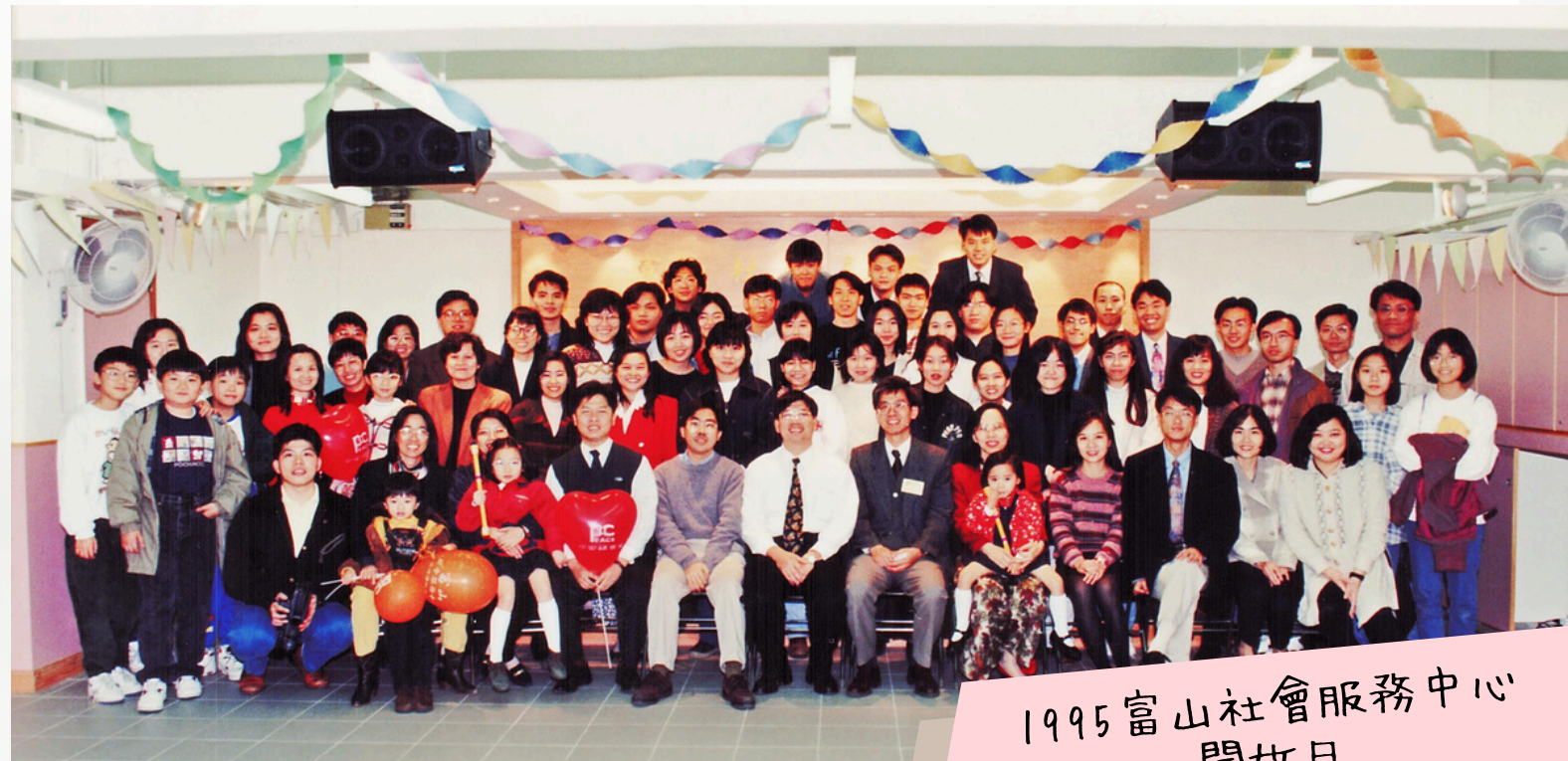
1995 富山社會服務中心 開放日

4月6日為30周年堂慶異象回顧，活動後有愛筵，若肢體有感恩回應，可以帶少量食物或飲品與弟兄姊妹分享，為免重疊，請於3月31日或之前通知幹事，以作協調。